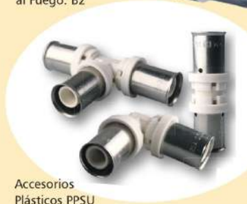
Accesorios Plásticos PPSU

Tubos multicapa con alma de aluminio soldada a tope, compuestos por capas. Los tubos multicapa con alma de aluminio se distinguen de los tubos totalmente plásticos por su mayor resistencia a la temperatura y presión, así como por su estabilidad dimensional y facilidad de instalación.