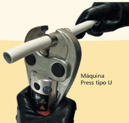
Máquina Press tipo U